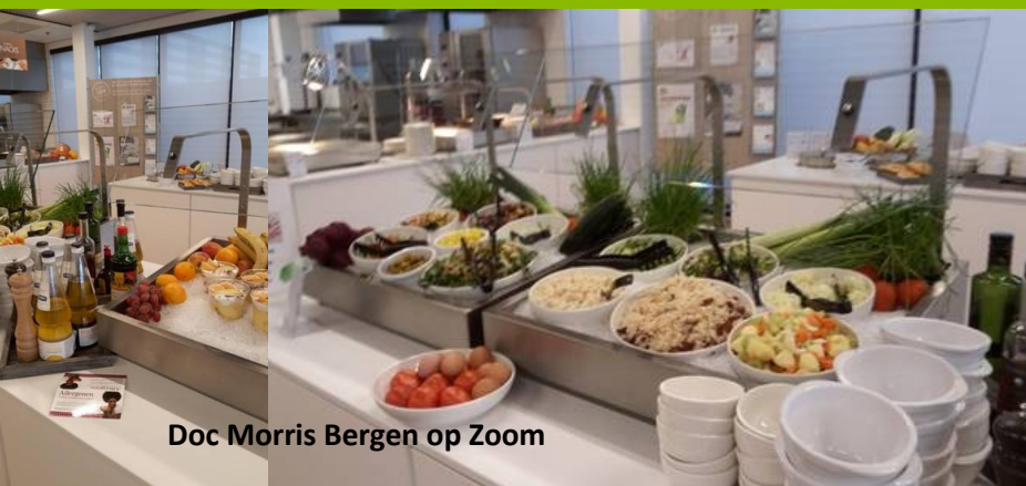
Doc Morris Bergen op Zoom